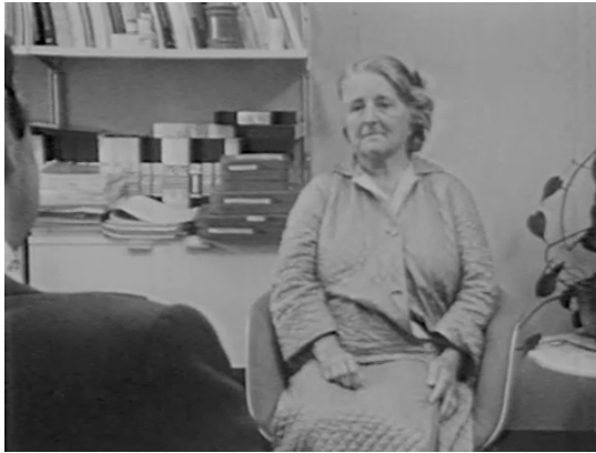
Fig. 6: Psychose, melancholische Phase bei einer älteren Person (Psychose maniaco-dépressive : accès mélancolique chez une personne âgée, ScienceFilm/Delagrangre, 1971).