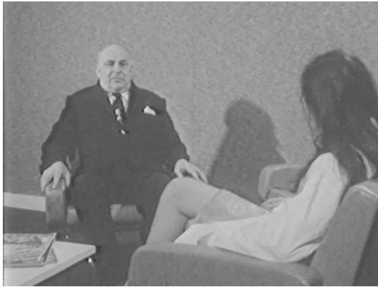
Fig. 5: Chronischer Verfolgungs- und Größenwahn (Délire chronique persécutif et mégalomaniaque, ScienceFilm/Delagrangé, 1971). Im Vordergrund die junge Psychiaterin und der Kamera zugewandt der sechzigjährige Patient.

Einstellung des 11-minütigen Films zwischen dem Oberkörper des Patienten und seiner Gestik, um sich dann wieder auf seinen Gesichtsausdruck zu konzentrieren. Die Psychiaterin ist nur noch durch die off-voice gegenwärtig und greift kaum in den Verlauf des Gesprächs ein, nur mit seltenen „und dann ...“-Einfügungen, um die Darstellung zu beleben, aber ohne sie zu steuern.